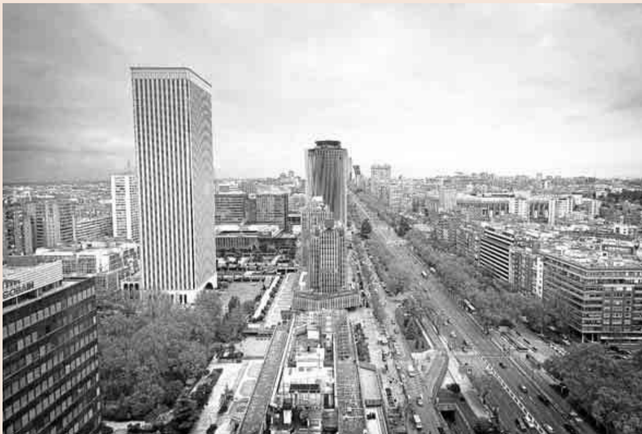
El Paseo de la Castellana de Madrid concentra la mayoría de las sedes de los principales bufetes de la abogacía de los negocios en España.

Analizando los despachos de abogados presentes en la clasificación de este año, observamos como Garrigues logra auparse de nuevo a lo