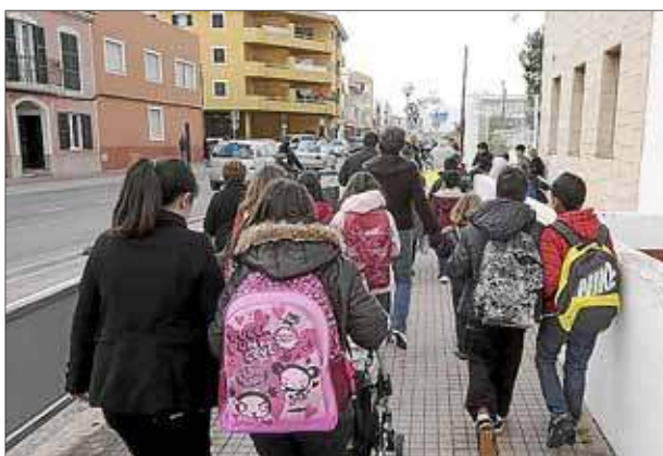
Un grupo de niños, a la salida del colegio.

La UCIDE recuerda que en 1996 se aprobó y publicó el contenido o currículo de las clases de Enseñanza Religiosa Islámica, así como el