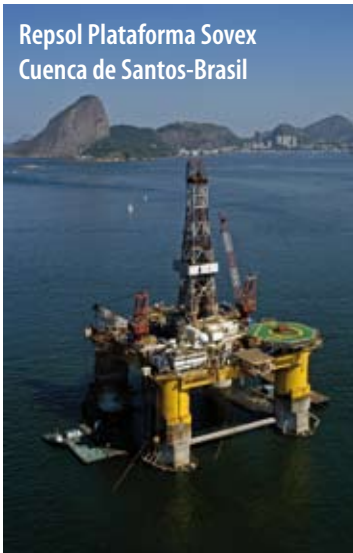
Repsol Plataforma Sovex Cuenca de Santos-Brasil

confirma el elevado potencial de producción en Brasil