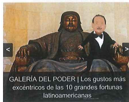
GALERÍA DEL PODER | Los gustos más excéntricos de las 10 grandes fortunas latinoamericanas