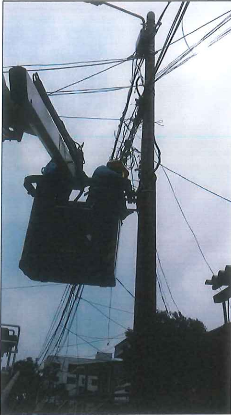
"El problema que menos le importa a un sector relevante de la clase dirigente es Electricaribe" / Twitter: Electricaribe SA