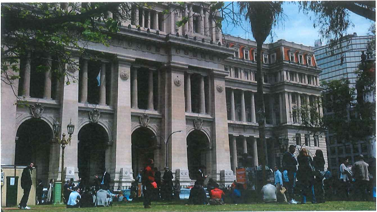
Sede del Palacio de Justicia de Buenos Aires.

El mar ya no parece tan revuelto, pero todavía brama. La tormenta de nacionalizaciones, que desataron diversas naciones latinoamericanas ( Venezuela , Argentina , Bolivia y Ecuador ), ha dejado estragos entre los empresarios españoles, que han encendido nuevamente las alarmas por la intervención, y la liquidación, de Electricaribe, la filial de Gas Natural Fenosa en Colombia. Ante ello, los dueños de los capitales han vuelto a alzar la voz para exigir a los países de la región una mejora en la seguridad jurídica y mayor protección a la inversión.