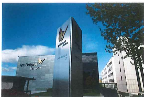
Gas Natural Fenosa reclama a Colombia más de 1.000 millones de euros

Encuentros que han puesto de manifiesto la "preocupación" por la protección a los derechos de los accionistas minoritarios en diferentes países de América Latina y la liquidación de Electricaribe cuatro meses después de ser intervenida y tras un fallido diálogo para alcanzar una solución pactada.