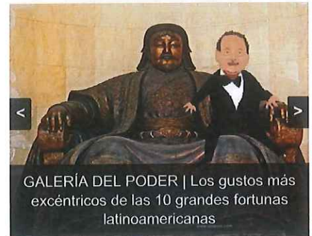
GALERÍA DEL PODER | Los gustos más excéntricos de las 10 grandes fortunas latinoamericanas