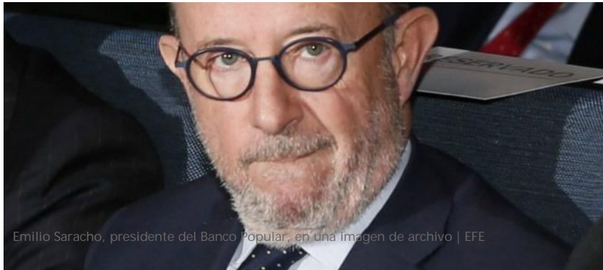
Emilio Saracho, presidente del Banco Popular, en una imagen de archivo