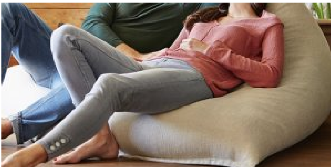
Este curioso seguro de hogar está revolucionando el mercado ¡Desde 55 € / año!