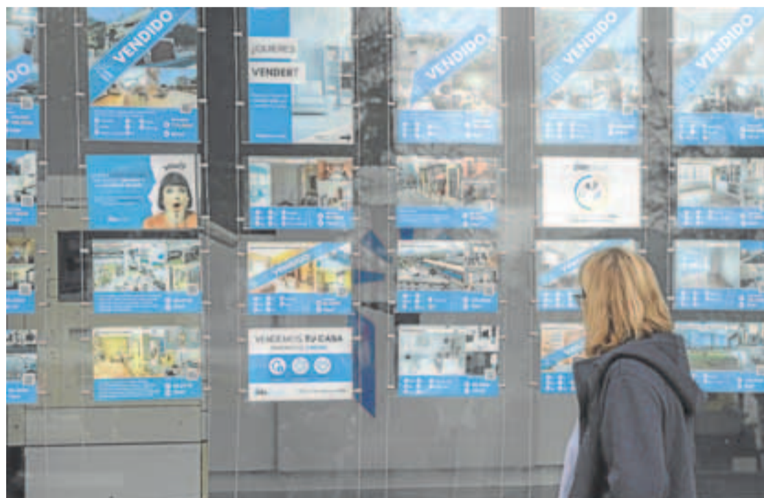
Ofertas de pisos en el escaparate de una agencia inmobiliaria.

En los escritos que han remitido a la compañía y ha dado a conocer la CNMV, los afectados por los ceses denuncian la existencia de una acción concertada de los tres accionistas —entre todos controlan aproximadamente el 38% del capital social de Indra. Y ello, añaden, con un desprecio olímpico por las normas de buen gobierno corporativo.