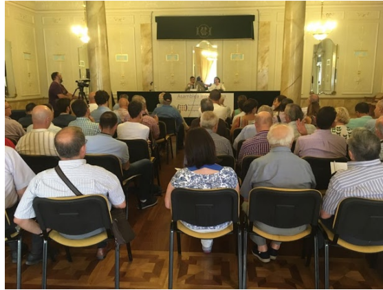
Asamblea de AEMEC del pasado mes de julio con los afectados por el Popular La Voz .