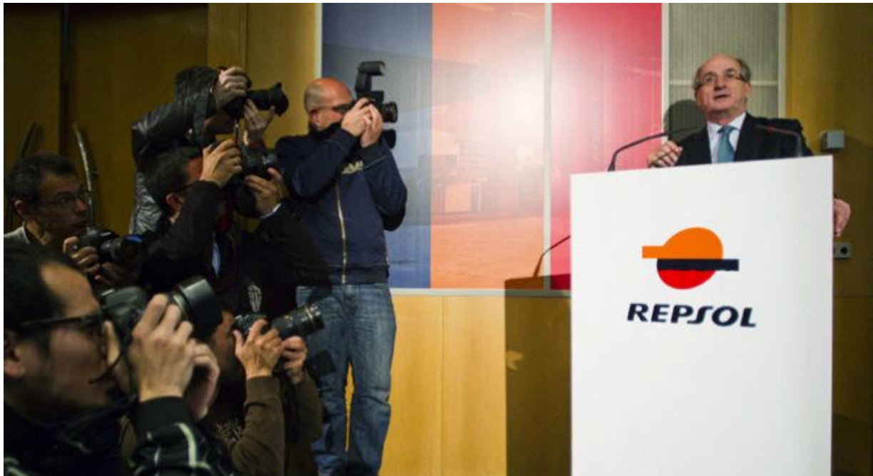
El presidente de Repsol

El contrato del presidente de Repsol , Antonio Brufau, finaliza en marzo de 2019. Con 70 años a nadie extrañaría su merecida jubilación, si bien los números -y los propios accionistas de todo tipo- respaldan su gestión al frente de la petrolera y podría continuar en el puesto.