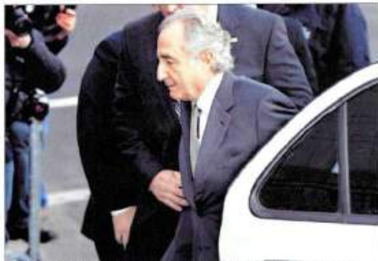
Bernard Madoff, autor de la mayor estafa piramidal, es conducido al Tribunal Federal de Nueva York, en Estados Unidos.

"Estamos muy satisfechos por haber llegado a un acuerdo tan favorable con Optimal, que pagará más de 235 millones de dólares para evitar demandas. Esperamos que otras entidades que tienen demandas tomen nota de este pacto, por el beneficio de todas las víctimas de Madoff", aseguró Picard al diario Financial Times.