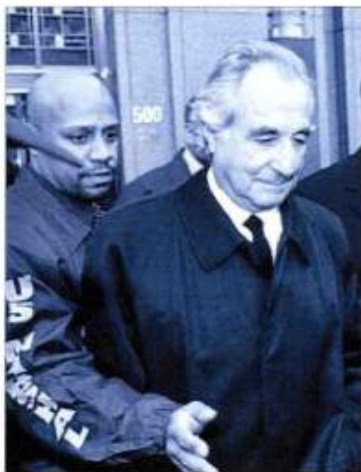
El inversor Bernard Madoff, a su salida de la Corte Federal de Nueva York.

Además, después de analizar los movimientos de ambos vehículos de inversión y la relación financiera de Optimal con Madoff, el administrador judicial concluye