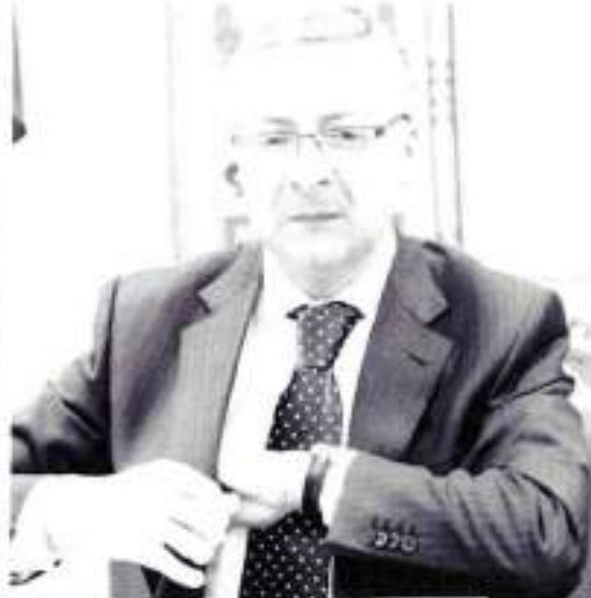
PROPUESTA. El ministro de Fomento, José Blanco.

Como 'aperitivo', Blanco explicó que Fomento va a librar en los próximos meses 400 millones de euros con los que dar 'oxígeno' a las empresas adjudicatarias de 80 pequeñas obras de carreteras. El camino emprendido no es baladí, ya que ese dinero pretende poner en marcha actuaciones hoy casi