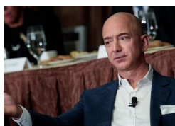
El dueño de Amazon presenta un reloj que

La actriz mexicana Karla Souza denuncia haber sido violada por un director de cine