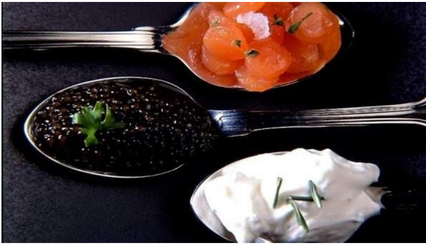
Gastronomía hoteles

Cocineros, abogados y exfiscales han participado este lunes en el I Congreso Europeo de Derecho y Gastronomía celebrado en la Feria de Madrid.