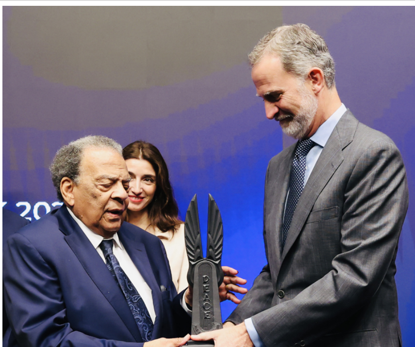
Andrew Young y Felipe VI

Su Majestad el Rey Felipe VI ha entregado el World Liberty & Peace Award a Andrew Young, destacado líder de los derechos civiles estadounidenses. El máximo galardón que concede la World Jurist Association (WJA) y que está considerado como el Premio Nobel del derecho. En palabras de S.M. el Rey, Andrew Young “ha contribuido a cambiar a mejor el curso de la historia de Estados Unidos y lo hizo con su propia experiencia y con el esfuerzo de toda una vida; el servicio a los demás ha definido su carrera siempre con un espíritu de humildad, pacifismo y serenidad”.