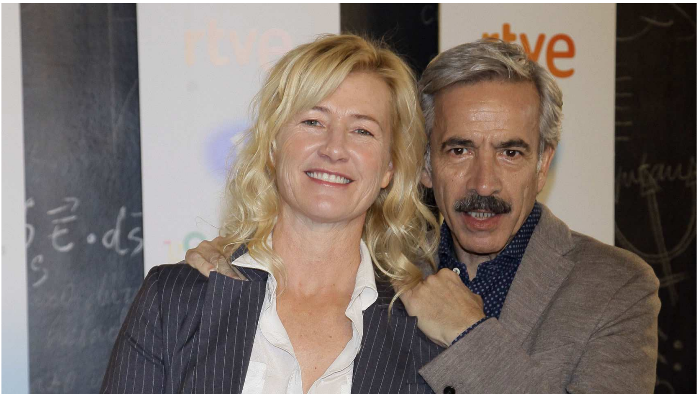
Los actores Ana Duato e Imanol Arias.