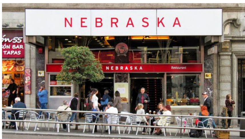
Cafetería Nebraska en la Gran Vía de Madrid.